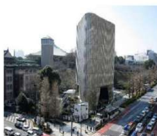
▲見晴らしの良い景色です！