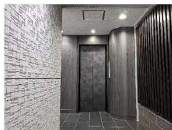
▲2017年7月 エントランスリニューアル